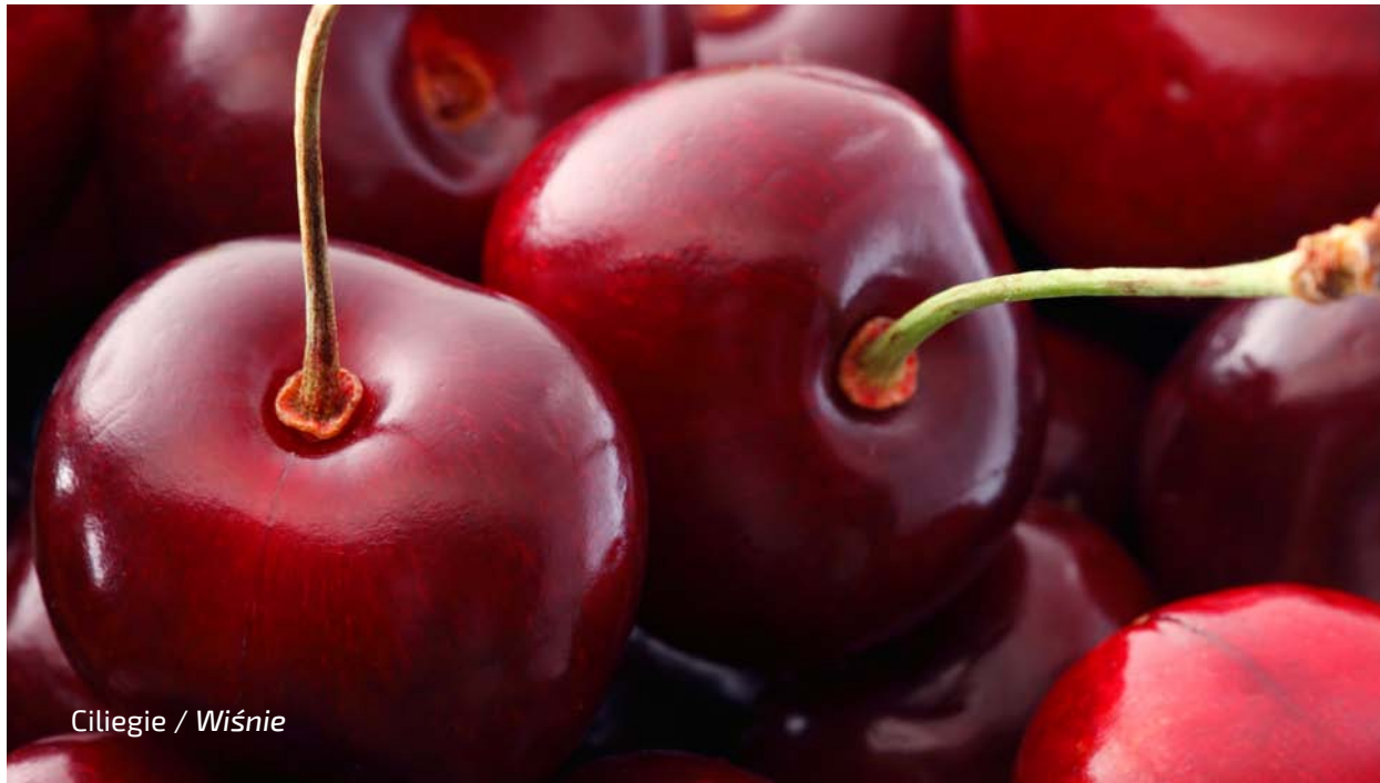
Ciliegie / Wiśnie