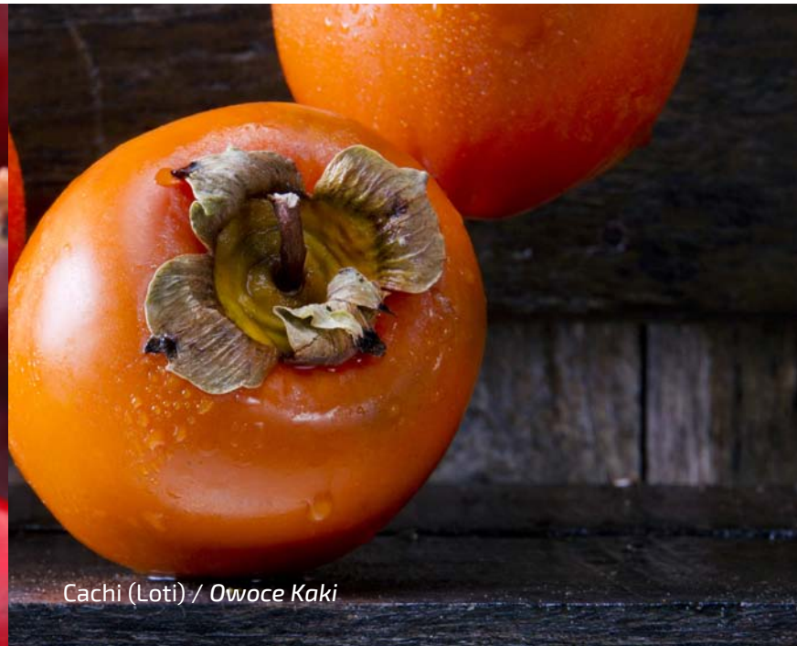
Cachi (Loti) / Owoce Kaki