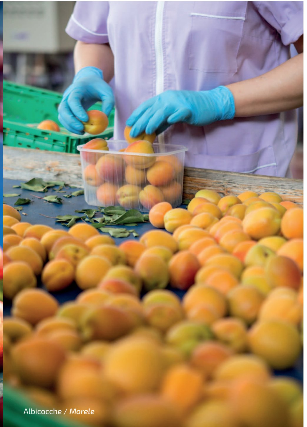
Albicocche / Morele