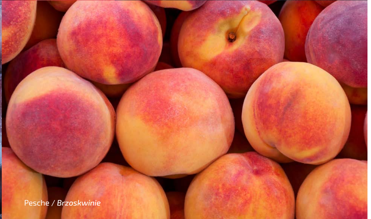
Pesche / Brzoskwinie