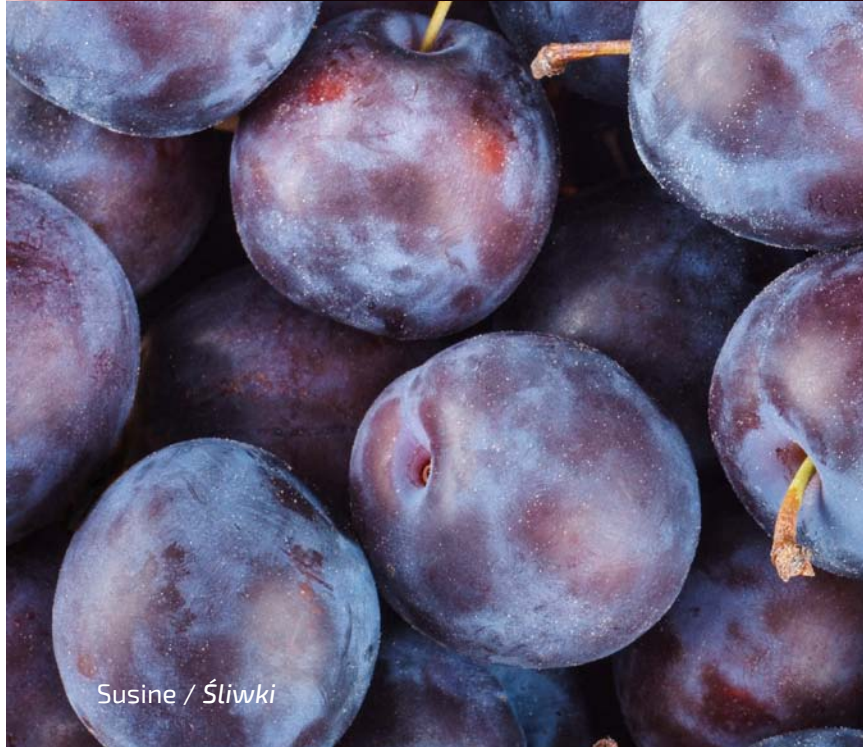
Susine / Śliwki