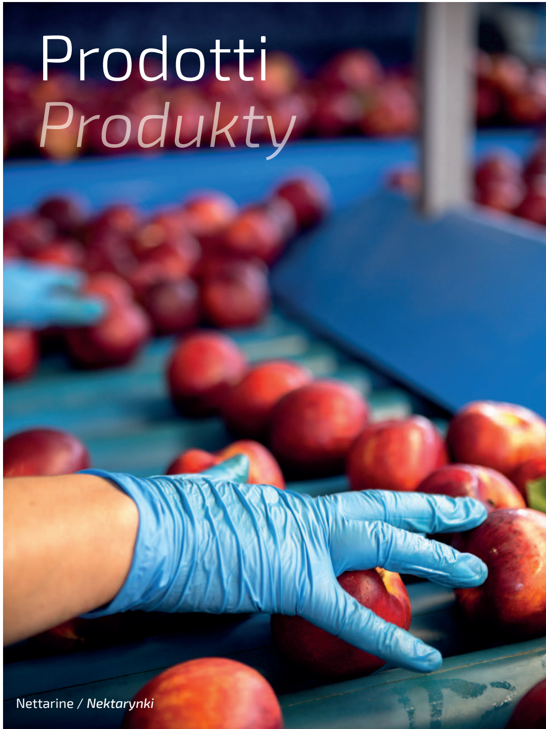
Nettarine / Nektarynki